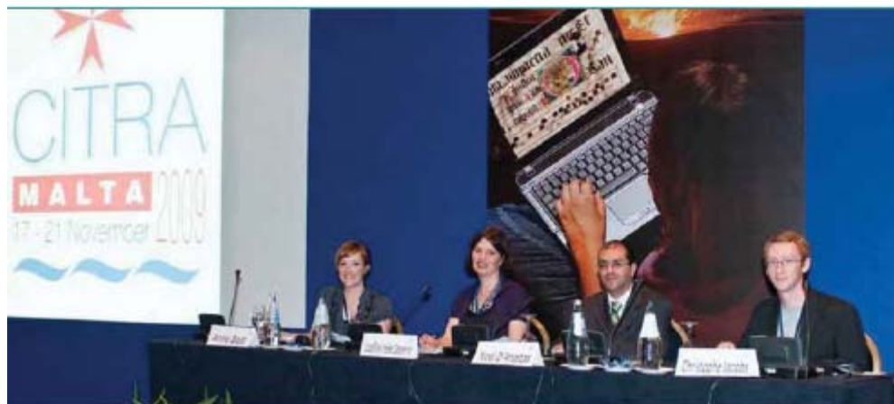
FOTO: Corresponsales de Malta (arriba) y de Montevideo (a la izquierda).

Desde que la iniciativa de los “Flying reporters” se gestó en el Congreso de Kuala Lumpur en julio de 2008, ha llegado a ser habitual, la presencia de estos jóvenes profesionales que analizan las sesiones y entrevistan a los participantes del ICA.