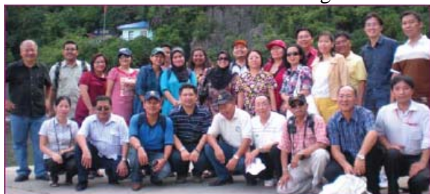
Visite à la baie d'Halong