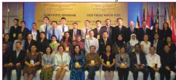
Réunion du bureau exécutif

A finales de 2009, SARBICA organizó simultáneamente dos acontecimientos: la 4ª reunión del 17º Comité Ejecutivo de SARBICA y un Seminario sobre “Digitalización de documentos de archivos - Compartir las experiencias” que tuvo lugar en Hanoi, Vietnam, los días 1 y 2 de octubre de 2009. El Seminario había sido organizado conjuntamente por la Rama Regional del ICA del Sudeste de Asia (SARBICA) y el departamento de documentos y archivos del Estado de Vietnam (SRADV).