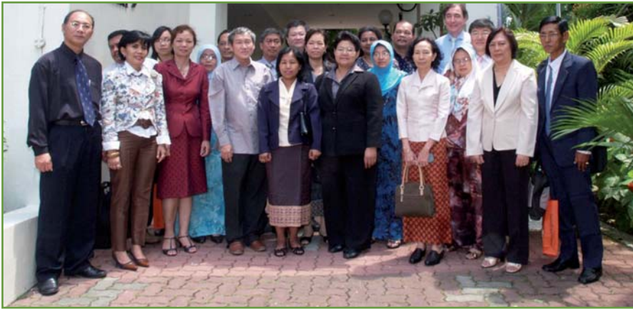
SARBICA, Singapour 2009.