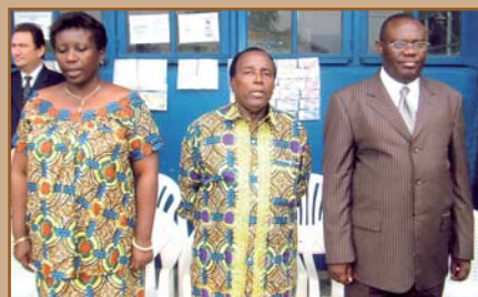
Mme le directeur général adjoint des Archives nationales de la République démocratique du Congo, Son Excellence Monsieur le ministre de la Culture et des Arts, le directeur général des Archives nationales de la République démocratique du Congo.

Archiviste adjointe, Scottish Business Archive, Tél. +44 (0)141 330 4159