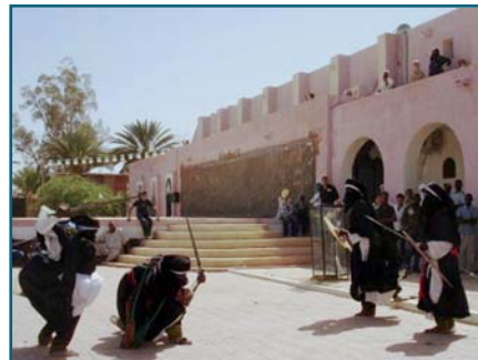
EB Tamanrasset 2009, désert.

experts juristes indépendants. Les principales conclusions ont été que le terme de « fondation » devrait être évité dans le cadre de discussions stratégiques sur la recherche de sources de revenus, car il peut avoir des sens très différents dans différents pays ; par ailleurs les statuts d'une entité générant des revenus peuvent dériver de la constitution de l'ICA, plutôt que de créer un corps juridiquement indépendant fonctionnant selon son propre droit ; des modifications de la constitution permettant de clarifier la mission de l'organisation dans le domaine de la recherche de sources de revenus seront proposées à l'assemblée générale à Malte en novembre 2009 ; enfin, on fera appel à une expertise juridique pour déterminer dans quelle mesure les structures existantes de l'ICA peuvent fournir une base pour des activités générant des revenus.