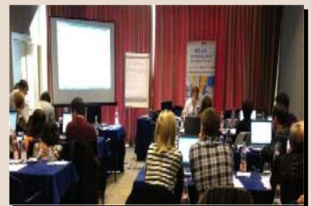
ورشة APE على الخط

عقد أول اجتماع في برلين في 12 أبريل 2011. حضر فيه 15 مشترك من ثمانية بلدان: ألبانيا، النمسا، كرواتيا، ليشتنستن، لكسمبورغ، نرويج، صربيا، و سويسرا. أعلن سبعة بلدان منهم أنهم مهتمين بأن يكونوا ممولين لمضمون بوابة الأرشيف الأوربي، و اثنين منهما (كرواتيا و النرويج) أعلنوا أنهما سيعملان كشريكين في المشروع APEX المشروع الممول لمشروع أبنت.