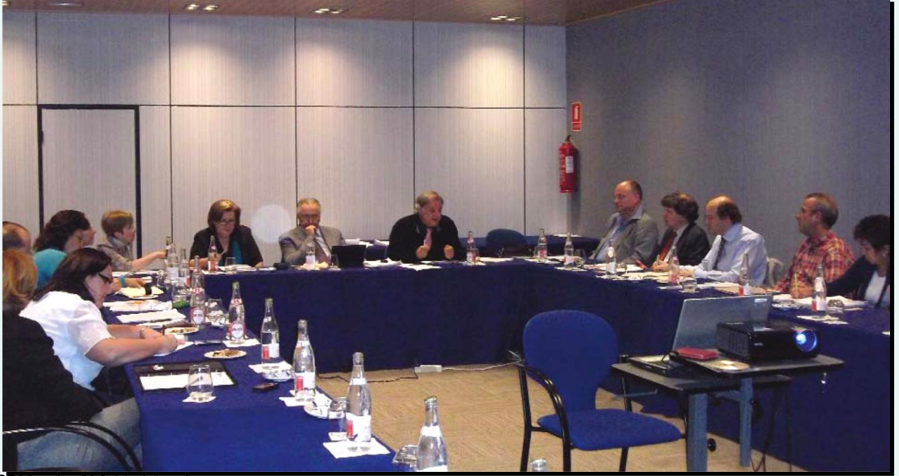
الجمعية العامة لـ ALA، توليدو 2011.

تستمر ALA في الوقت الحالي بتنفيذ مخطط إستراتيجيتها من 2011 إلى 2015 من أجل تطوير نفسها بواسطة عدة مشاريع كتحفيز انضمام أعضاء جدد و انضمام دول أكثر، دعم البحث و تبادل المعرفة، إنشاء و إعادة تنظيم لجانها التقنية (CTs) و مجموعات العمل (GTs). من أجل معلومات أكثر زوروا الموقع الإلكتروني الجديد لـ ALA :