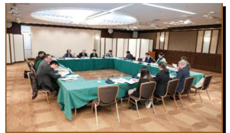
مكتب EASATICA ، طوكيو 2011