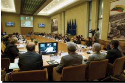
الندوة السنوية لقسم الأحزاب السياسية، فيلنيوس 2011.

خلال اجتماع فلنيوز تبنت الجمعية العامة لـ SPP حل يمكن الإطلاع عليه على الموقع الإلكتروني للمجلس الدولي للأرشيف، في فضاء العضو: