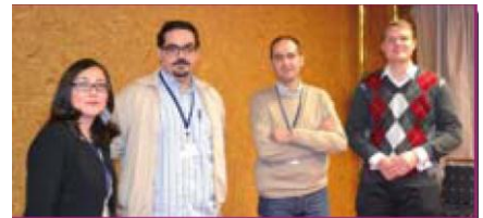
المجلس للمجلس الدولي للأرشيف، توليدو 2011.