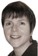
rockett أمينة عامة مساعدة للمجلس الدولي للأرشيف للندوات a.org