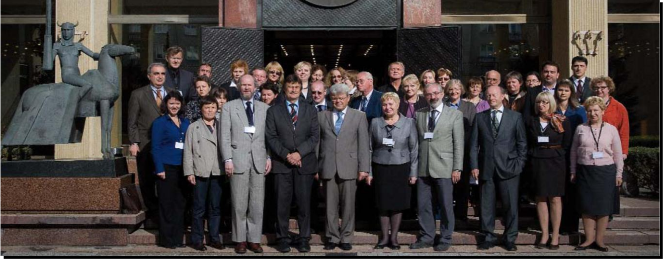
الندوة السنوية لقسم الأحزاب السياسية، فيلنيوس 2011