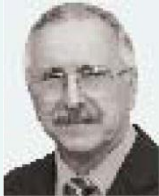
es da Sliva

نائب رئيس المجلس الدولي للأرشيف للفروع رئيس ALA Ala.presidencia@ Arquivonacional.gov.br