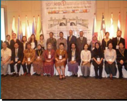
المكتب التنفيذي و اليوم الدراسي لساربيكا، مانيل 2011