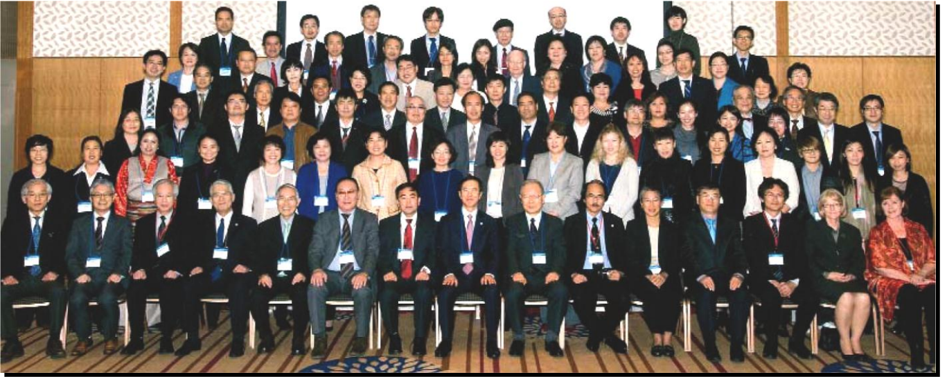
الندوة العامة لـ EASATICA ، طوكيو 2011