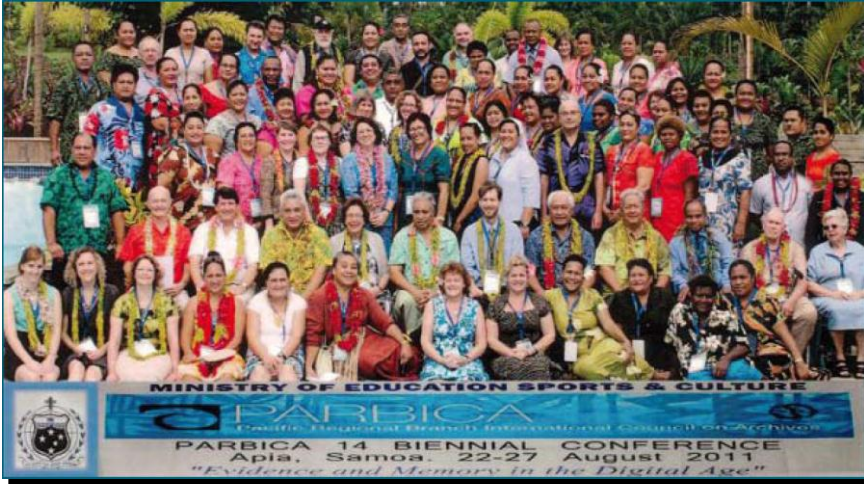
باربيكا 14، Apia 2011

عرفت باربيكا مرحلة الإنجازات الكبيرة و الدعم من طرف الشركاء الممومنين. فلقد قمنا بإنجازات كبيرة في مجال الأرشفة الإلكترونية في منطقة المحيط الهادي بفضل علبة الوسائل "أرشفة جيدة مفتاح الحكم الراشد". هدف المكتب الآن هو دعم هذا العمل الكبير و مراقبة الوسائل من أجل استعمال علبة الوسائل في جميع منطقة المحيط الهادي.