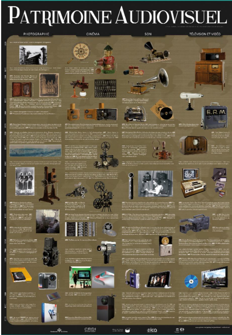
التراث السمعي البصري