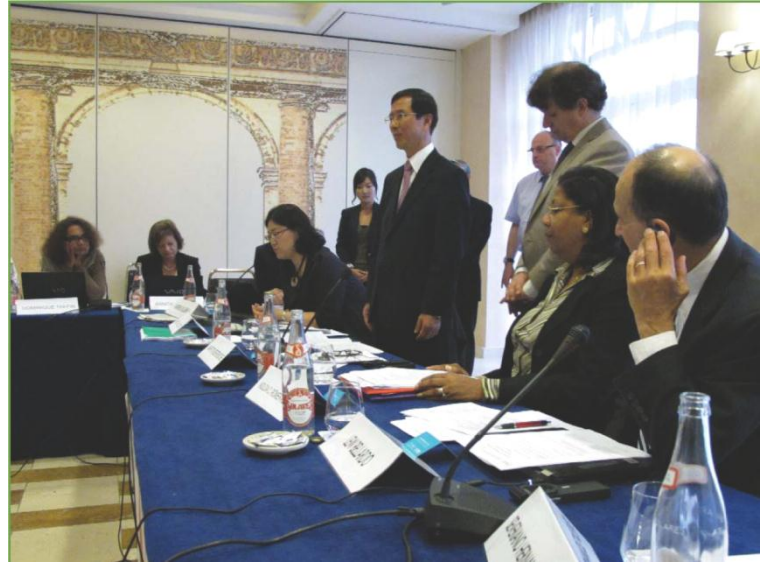
الهيئة التنفيذية توليدو، 2011.