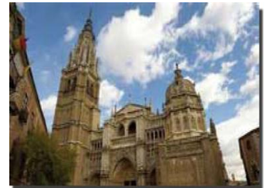
سيترا توليدو، 2011