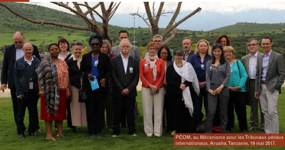
PCOM, au Mécanisme pour les Tribunaux pénaux internationaux, Arusha, Tanzanie, 19 mai 2017.

Lors de la réunion de la Commission du Programme (PCOM) à Arusha (Tanzanie) en mai 2017, les membres ont approuvé à l'unanimité la stratégie et les recommandations définissant le premier programme de formation complète et intégrée de l'ICA. Ce programme sera développé en parallèle du Programme Nouveaux Professionnels et du Programme pour l'Afrique, ces trois axes étant élaborés en cohérence pour analyser et traiter les priorités définies par PCOM en matière d'expertise professionnelle, de soutien et de développement de l'ICA. Le programme de formation adoptera une approche stratégique, fondée sur les méthodes de formation déjà en vigueur à l'ICA. L'ICA participe en effet déjà au financement de formations via PCOM et FIDA, et publie également des ressources et des outils qui peuvent être utilisés pour l'autoapprentissage et les formateurs. Ces activités se poursuivront, mais désormais, des outils d'apprentissage en ligne et des programmes complets de formation