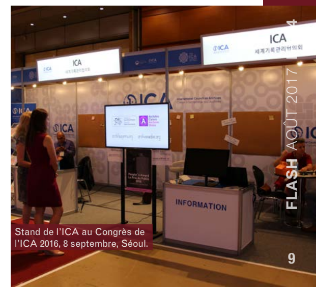
Stand de l'ICA au Congrès de l'ICA 2016, 8 septembre, Séoul.

Présidente de l'AEG, ICA roberto@ica.org