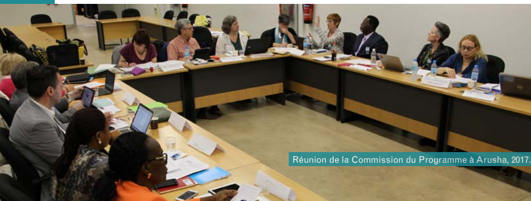
Réunion de la Commission du Programme à Arusha, 2017.