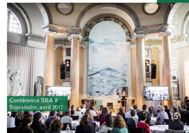
Conférence SBA à Stockholm, avril 2017.