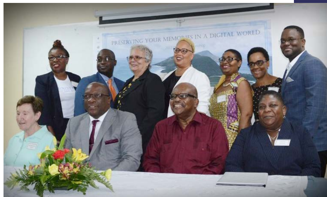
Atelier de formation « Préserver vos souvenirs dans un monde numérique », 26, 27 et 28 avril à Basseterre, Saint-Christophe.

Ce projet était un atelier communautaire d'une durée de trois jours intitulé « Préserver vos souvenirs dans un monde numérique ». Il ciblait tant les membres de groupes intéressés par le