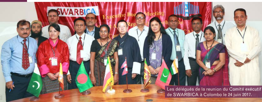
Les délégués de la réunion du Comité exécutif de SWARBICA à Colombo le 24 juin 2017.

Le comité exécutif de la Branche régionale pour l'Asie du Sud et de l'Ouest (SWARBICA) s'est tenu à Colombo au Sri Lanka du 21 au 24 juin 2017 en même temps qu'un atelier de formation sur la gestion des documents numériques, et que l'inauguration d'un premier centre d'archives numériques.