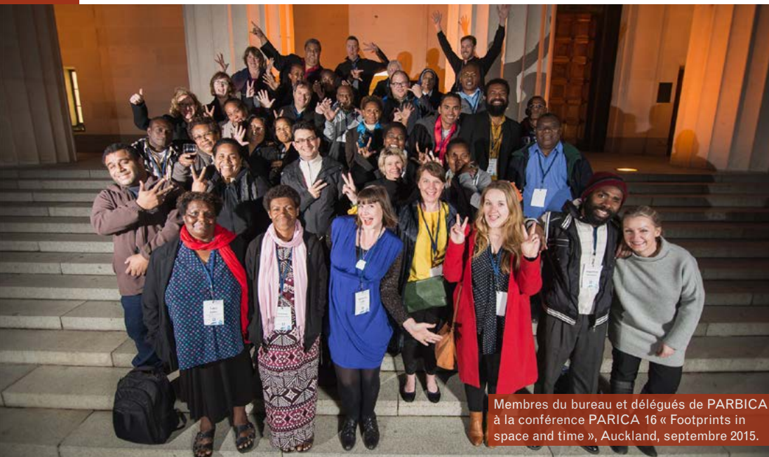
Membres du bureau et délégués de PARBICA à la conférence PARICA 16 « Footprints in space and time », Auckland, septembre 2015.

PARBICA, la Branche régionale pour le Pacifique de l'ICA, a le plaisir de vous inviter à vous inscrire pour PARBICA 17, notre 17 e conférence. Les îles Fidji sont une plateforme d'échanges d'idées, de langues, de pratiques culturelles et d'objets depuis des siècles. Nous vous invitons à vous joindre à nous à Suva du 4 au 7 septembre 2017 pour partager nos savoirs, nos compétences et notre expérience pour le bénéfice de tous nos membres et de nos partenaires. Le thème de PARBICA 17 est « Archives engagées : le personnel, la profession et le politique », un thème qui reflète le monde moderne et en transformation de 2017. Ces temps sont vraiment intéressants pour notre