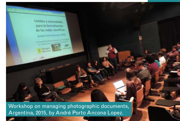
Workshop on managing photographic documents, Argentina, 2015, by André Porto Ancona Lopez.