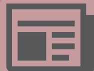
Diaris i revistes