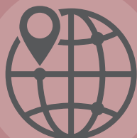
Mapes i plànols