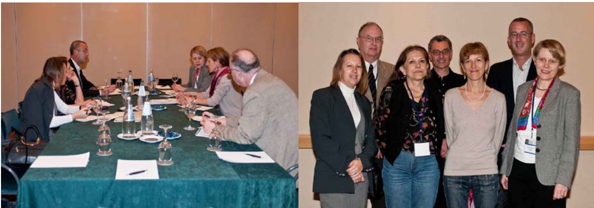
Le Comité directeur d'EURBICA, pendant la réunion à Malte (le 16 novembre 2009) EURBICA

Lors de ses réunions de 2009 à Malte et de 2010 à Oslo, le Comité directeur d'EURBICA a pris plusieurs décisions importantes. Les nouveaux statuts d'EURBICA ont été préparés et distribués aux membres, en vue d'une discussion et pour recueillir des propositions de modifications éventuelles. Les statuts peuvent être consultés aussi sur le site web de l'ICA. En ce qui concerne les informations budgétaires, il importe de souligner qu'EURBICA a consacré tous les fonds ordinaires de 2009 et 2010 à la 8 ème Conférence européenne sur l'archivage digital, qui s'est tenue à Genève en 2010. En effet, EURBICA était, ensemble avec ICA/SPA, un des organisateurs de la conférence.