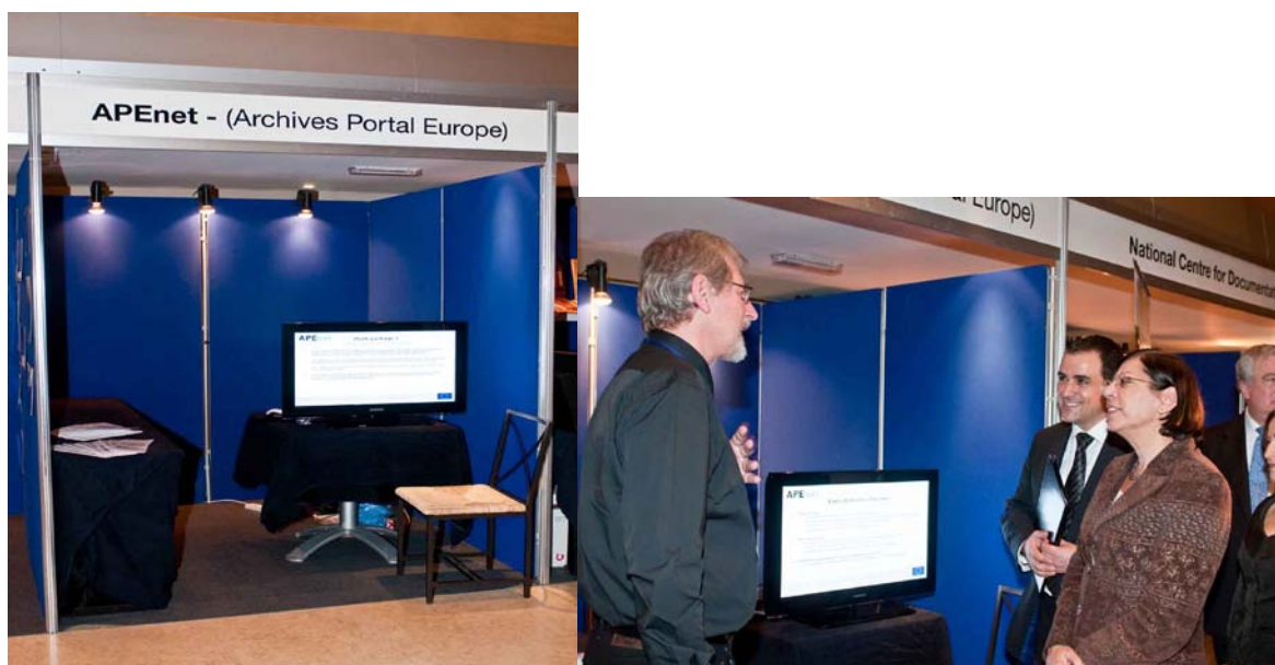
Présentation d'APEnet lors de la conférence CITRA à Malte, Peder Andrén (Archives nationales de Suède), présente le projet à l' Hon. Dolores Kristina, Ministre de l'Éducation, de la Culture, de la Jeunesse et du Sport de Malte et à Charles Farrugia, hôte de CITRA 2009.