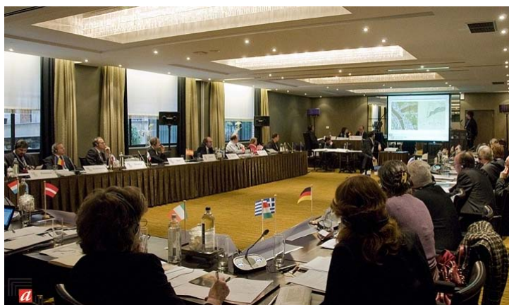
Une session de la réunion de l'EBNA

Sous la Présidence belge de l'UE, trois événements ont été organisés en automne 2010, à savoir les réunions de respectivement l'EBNA (18 - 19.11.2010), l'EAG (Groupe européen d'Archives ; 19.11.2010) et du DLM Forum (16 -17.11.2010). L'EBNA (European Board of National Archivists de l'UE), instauré en 2001, se réunit deux fois par an, chaque fois dans le pays qui préside le Conseil de l'Union européenne. Le programme belge de l'EBNA contenait les thèmes suivants: a) l'acquisition et l'accès au public des archives d'entreprises : les bonnes pratiques, b) l'accès aux sources cartographiques : projets de numérisation et collaboration internationale, c) Archives de la Première Guerre mondiale : phénomène de mode ou pierre angulaire? d) la sélection et le transfert d'informations (dé)classifiées. Les présentations et les photos sont disponibles sur: http://extranet.arch.be/arch/ebna/ .