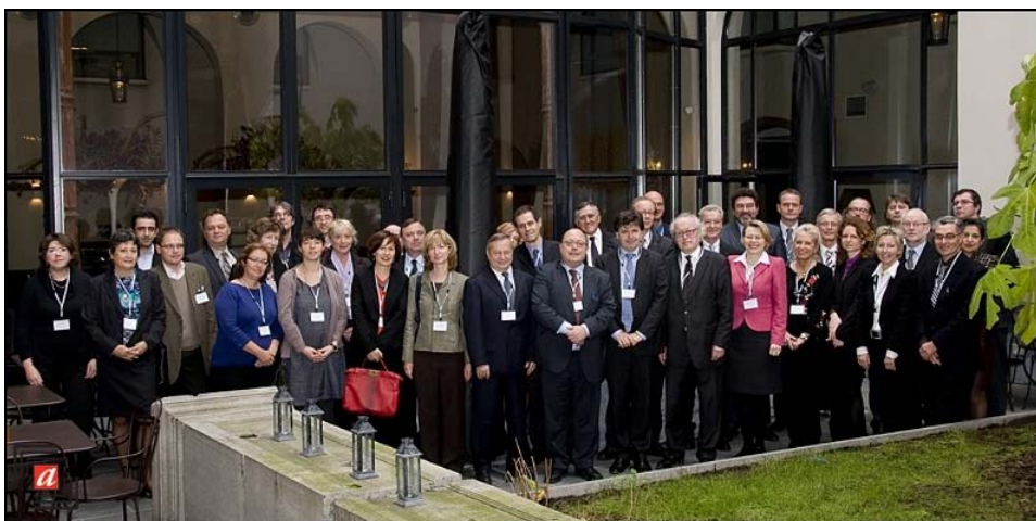
EBNA Bruxelles, photo de groupe des participants.

L'EAG (Groupe européen des archives, créé en 2005) a discuté les thèmes suivants: a) la préservation et la prévention des calamités, b) le renforcement de la coopération interdisciplinaire européenne en matière de documents et d'archives numériques: le DLM Forum et le développement de MoReq2010, c) l'établissement d'un portail Internet pour les documents et les archives en Europe: APEnet, d) EURONOMOS: le droit des archives européennes en ligne, e) les défis de l'avenir – les premiers résultats d'un aperçu de l'EAG et les étapes suivantes : la réutilisation d'informations du secteur public ; les relations entre les accès aux archives en ligne et « onsite »; l'archivage numérique et le nouveau rôle des archives.