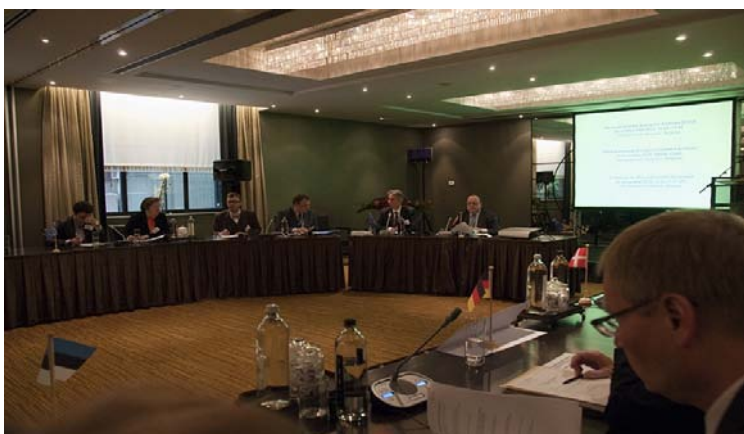
Réunion de l'EAG, 19.11.2010

L'EAG (Groupe européen des archives, créé en 2005) a discuté les thèmes suivants: a) la préservation et la prévention des calamités, b) le renforcement de la coopération interdisciplinaire européenne en matière de documents et d'archives numériques: le DLM Forum et le développement de MoReq2010, c) l'établissement d'un portail Internet pour les documents et les archives en Europe: APEnet, d) EURONOMOS: le droit des archives européennes en ligne, e) les défis de l'avenir – les premiers résultats d'un aperçu de l'EAG et les étapes suivantes : la réutilisation d'informations du secteur public ; les relations entre les accès aux archives en ligne et « onsite »; l'archivage numérique et le nouveau rôle des archives.